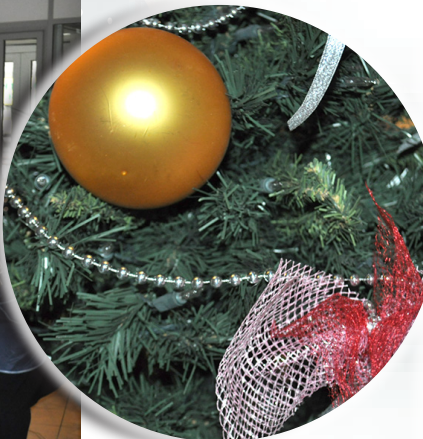
Енергетики прикрашають головний офіс